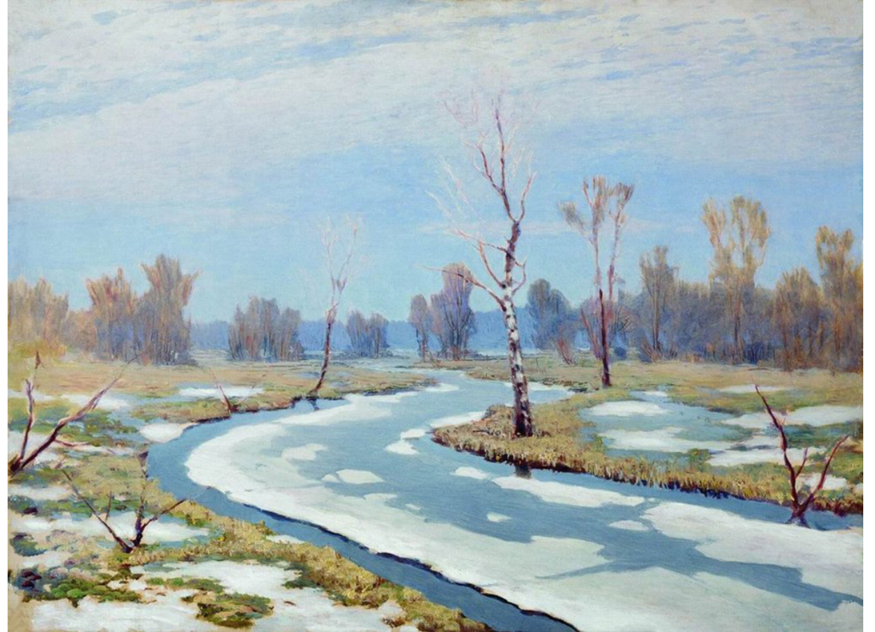
А. Куинджи «Ранняя весна»

Рассмотри картины. Расскажи, какое время года изображено на картинке?