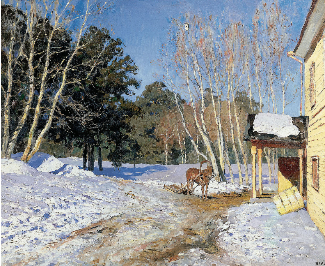
И. Левитан «Март»