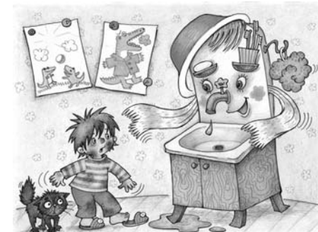
Пример демонстрационного материала из комплекта карточек «Что такое хорошо и что такое плохо».

III. Организационный раздел раскрывает: 1) основные подходы к организации образовательной деятельности в дошкольной образовательной организации; 2) рекомендации по адаптации парциальной программы «Мир Без Опасности» к запросу особого ребенка; 3) особенности взаимодействия педагогического коллектива с семьями воспитанников; 4) примерный перечень материалов и оборудования для создания развивающей предметно-пространственной среды; 5) список учебно-методических и наглядно-дидактических пособий, рекомендуемых для успешной реализации парциальной образовательной программы «Мир Без Опасности».