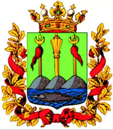
Герб Уральской области

620023 г. Екатеринбург, ул. Рощинская, 25 тел. (343) 289 – 25 - 20 ИНН 6674368867 КПП 667901001